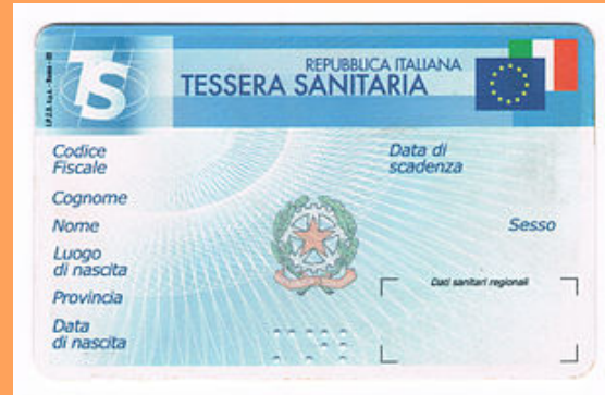
* TESSERA SANITARIA