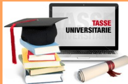
COPIA ULTIME TASSE PAGATE O ATTESTATO DI FREQUENZA