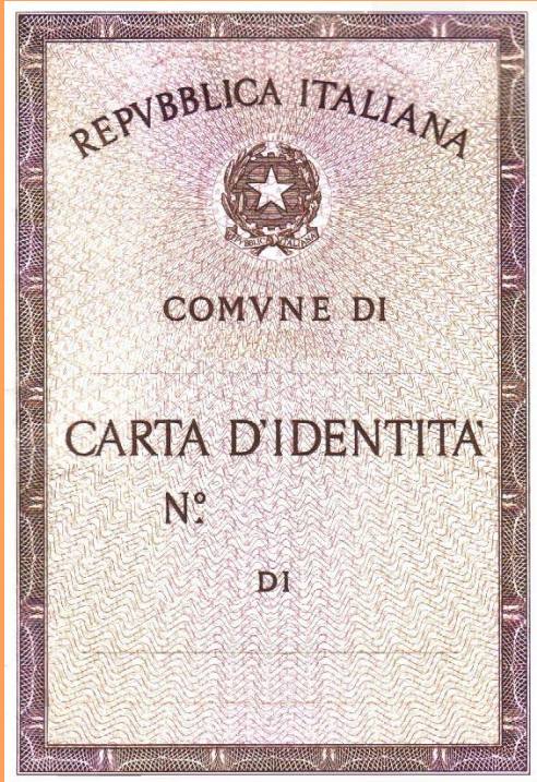
* CARTA D'IDENTITÀ'