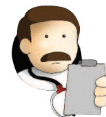
Il medico competente