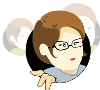
Il responsabile e gli addetti del servizio di prevenzione e protezione