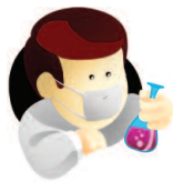
Il responsabile della attività didattica o di ricerca in laboratorio