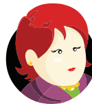
Il rappresentante dei lavoratori per la sicurezza