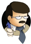
Il datore di lavoro

Le figure coinvolte dal decreto legislativo per l'attuazione della prevenzione sono soggetti fondamentali, e tutti essenziali, per il miglioramento dell'organizzazione della sicurezza in azienda o nell'unità produttiva.